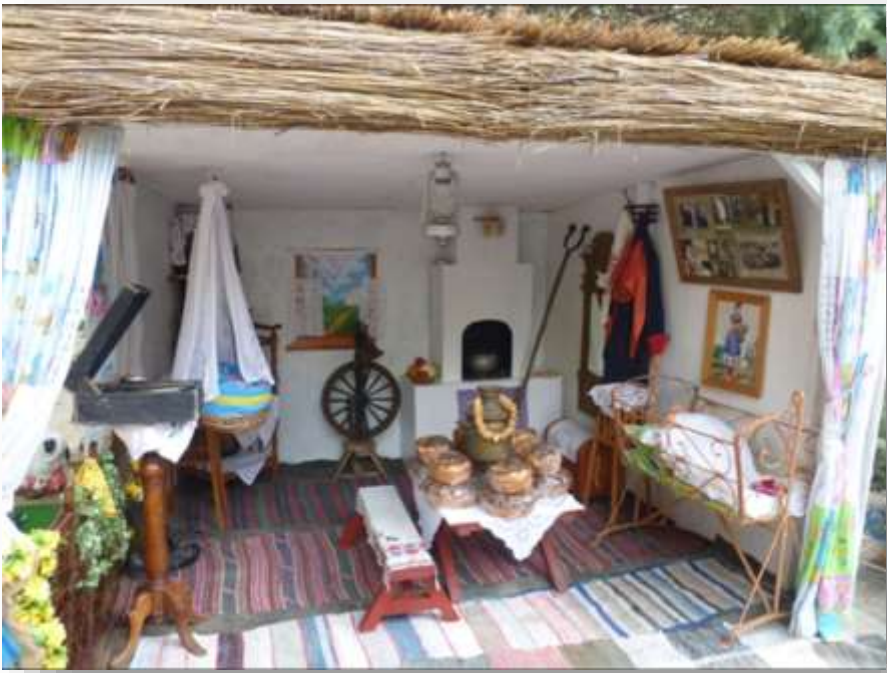
Мини-музей «Русская изба»