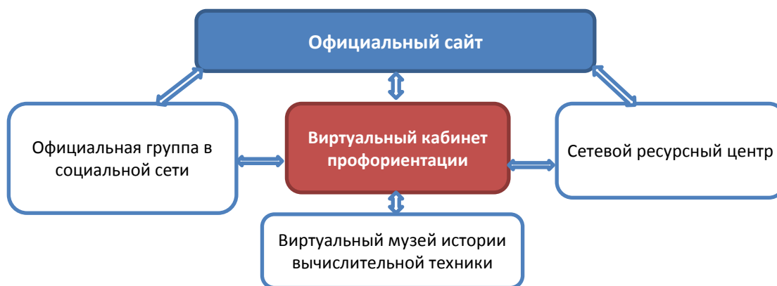
Рис.1 Комплекс информационных ресурсов ОУ

Виртуальное информационное пространство образовательного учреждения может включать в себя несколько интернет-ресурсов: официальный сайт ОУ, сайты структурных подразделений, сайты проектов и т.д. все они являются взаимосвязанными и образуют единую сеть.