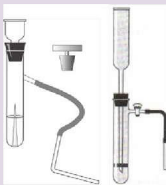
Рис. 7. Прибор для получения и собирания газов

Прибор для получения газов используется для получения небольших количеств газов: водорода, кислорода (из пероксида водорода), углекислого газа.