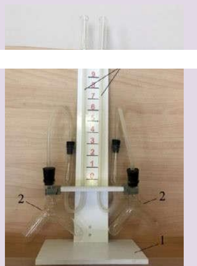
Рис. 4. Прибор для демонстрации зависимости скорости химических реакций от различных факторов: 1 — подставка; 2 — сосуды Ландольта; 3 — манометрические трубки

соединяются с сосудами Ландольта с помощью пластиковой трубки с пробками (рис. 5). Между манометрическими трубками на панели нанесена шкала для наблюдения уровня жидкости в трубках. Окрашенной жидкостью может быть раствор любого красителя в воде.