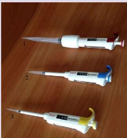
Рис. 5. Пипетки дозаторы одноканальные переменного объёма: 1 — 110 мл; 2 — 100—1000 мкл; 3 — 10—100 мкл.

Пипетка-дозатор — приспособление, используемое в лаборатории для отмеривания определённого объёма жидкости. Пипетки выпускаются переменного и постоянного объёма. В комплекты оборудования для медицинских классов входят удобные пипетки-дозаторы одноканальные, позволяющие настроить необходимый объём отбираемой жидкости в трёх различных диапазонах (рис. 6). Использование современных технологий и цветовой кодировки диапазона дозирования даёт возможность качественно, точно, безопасно выполнять пипетирование. Пипетки имеют сменные пластиковые наконечники.