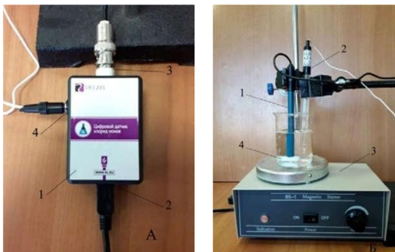
Рис. 2. Установка для определения концентрации (активности) хлорид-ионов в растворе. А: 1 — корпус датчика для определения \text{Cl}^- -ионов; 2 — разъём Micro USB для подключения к компьютеру; 3 — разъём BNC для подключения рабочего электрода; 4 — разъём для подключения электрода сравнения. Б: 1 — ионоселективный электрод (рабочий электрод); 2 — электрод сравнения (хлорсеребряный электрод); 3 — магнитная мешалка; 4 — якорь магнитной мешалки

компонент любого ИСЭ — мембрана, которая разделяет внутренний раствор с постоянной концентрацией определяемого иона и исследуемый раствор, а также служит средством электролитического контакта между ними. Мембрана обладает ионообменными свойствами, причём проницаемость её к ионам разного типа различна.